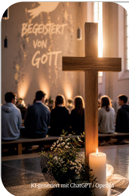
KI-generiert mit ChatGPT / OpenAI

Solltest du bis Mitte September keine persönliche Einladung erhalten haben, besteht die Möglichkeit, sich im Pfarrbüro zu melden und weitere Informationen zu erhalten. Auch ältere Jugendliche, die bisher noch nicht gefirmt wurden und Interesse an der Firmung haben, sind herzlich eingeladen, am Infoabend teilzunehmen.